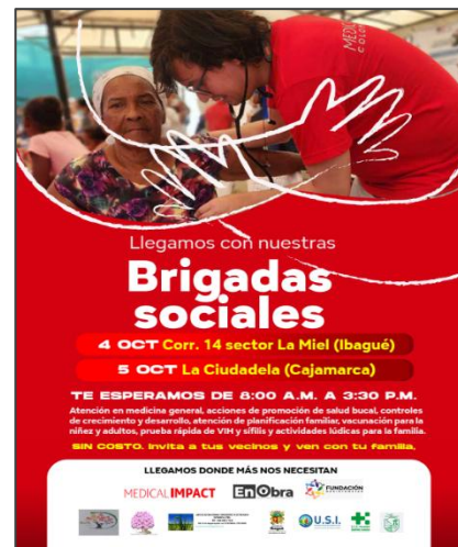
Ibagué y Cajamarca, octubre 4 y 5