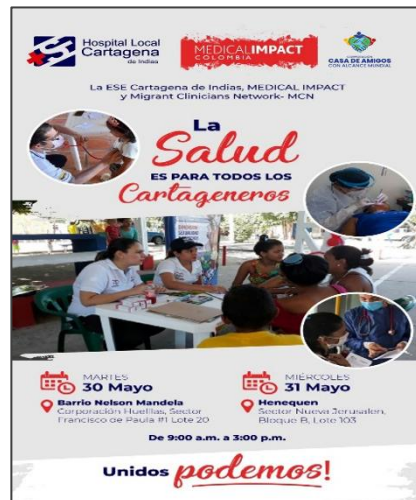
Cartagena, mayo 30 y 31 de 2023

Nuestro impacto es posible gracias a las alianzas multi-sector (gobierno, sector privado y sociedad civil) que garantizan la continuidad de los proyectos, así como las redes de trabajo colaborativo, como Migrant Clinicians Network – MCN y la Red de Salud y Bienestar de América Latina.