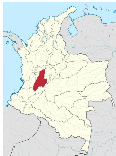
Departamento de Tolima en el Mapa de Colombia. https://commons.wikimedia.org

Su Capital, Ibagué, está ubicada en la Región Ibagué, la cual está conformada por los municipios (Microterritorios) de: Ibagué, Cajamarca, Rovira, Valle de San Juan, Alvarado y Piedras.