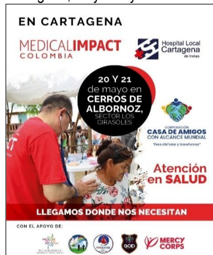
Cartagena, mayo 20 y 21 de 2024