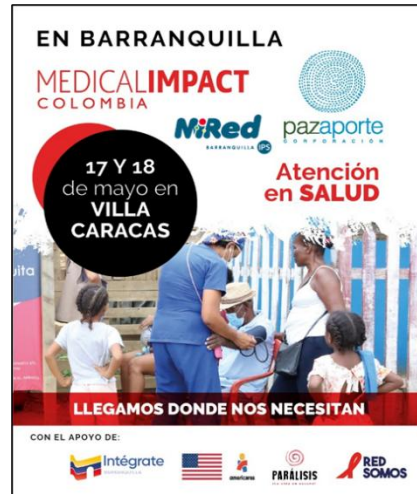
Barranquilla, mayo 17 y 18 de 2024